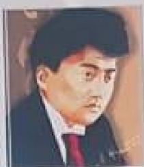
Мағжан Жұмабаев (1893-1938)